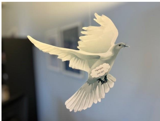
Duen, som symbol på Vågevagten i Selvhjælp