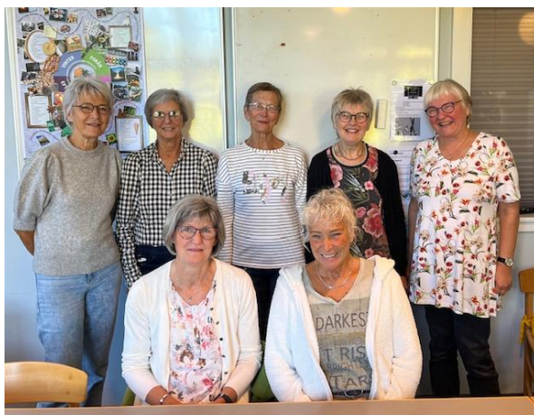
Sorggruppen efterår 2022

I 2022 havde Selvhjælp to sorggruppeforløb for hhv. seniorer og yngre voksne op til 50-års alderen, der har mistet ægtefælle eller partner. Sorggrupper er et fast tilbud i Selvhjælp, og vi oplever særligt stor efterspørgsel fra seniorer, der har mistet ægtefælle. Det er dejligt at opleve det sammenhold der også skabes i en sorggruppe; som én af deltagerne i en sorggruppe udtalte: "Det har været en virkelig god oplevelse, sammen med nye fantastiske kvinder. Håber, at det bliver et livslangt venskab" . I en sorggruppe deler man de tanker, bekymringer og følelser, som sorgen rummer, men der er også plads til hygge og gode grin.