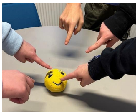
Glade børn fra en trivselsgruppe peger på en glad humørbold

I 2022 kom der to trivselsgrupper i gang på hhv. Kirstinebjergskolen og Krogsager Skole i Fredericia, og Fænøsund Friskole samt Vestre Skole i Middelfart sagde ja til også at få trivselsgrupper i gang. Begge trivselsgrupper har meldt tilbage, at børnene har været glade for at gå i gruppen. I den ene trivselsgruppe, har børnene arbejdet på at danne nye relationer på tværs af årgangene. Gruppelederne fortæller, at børnene har fået større kendskab til hinanden. De træner dem bl.a. i at turde tage del i sociale aktiviteter med nogen, man ikke kender. Børnene selv har bl.a. udtalt om det at være med i en trivselsgruppe: "Det er dejligt at komme her". "Det har været sjovt med de aktiviteter, vi har lavet". "Det er fedt og hyggeligt at sidde og snakke, man får åbnet op" "Jeg har fået nye venner" .