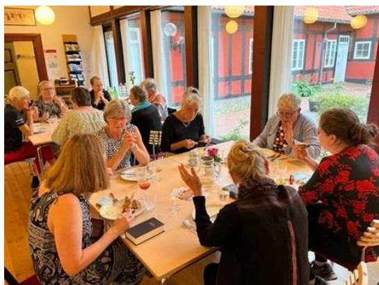
Dejlig mad og gode snakke