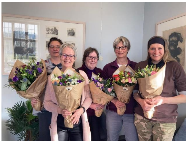
Glade vejvisere 2022

Vejviserne er i 2022 blevet forankret som et fast tilbud i Selvhjælp i samarbejde med Middelfart Kommune. Vejviserne ledsager ældre borgere til ønskede fællesskaber og aktiviteter i kommunen. Vejviserne fik i 2022 besøg af Middelfart Kommune, der kom med en flot buket til de seje vejvisere, som tak for deres indsats. Vejviserne består lige nu af et team på 8 frivillige vejvisere.