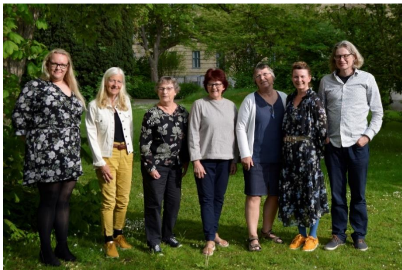
Bestyrelsen forår 2022