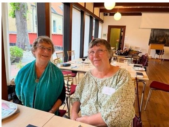
Glade frivillige til fest

I sep. 2022 fejrede vi alle vores frivillige med en sensommerfest. Takket være støtte fra "Fonden Ensomme Gamles Værn" kunne vi give vores frivillige en festlig aften med spændende indslag, lækker mad, og hver især fik de en lille gave med hjem, som tak for deres indsats. Det er alle vores seje frivillige, der tager individuelle samtaler, kører selvhjælpsgrupper, netværksaktiviteter og våger hos døende borgere. Bogholderiarbejde, PR-arbejde og kontakt til diverse fonde varetages også af nogle af vores frivillige. Takket være vores frivillige og deres kæmpe indsats, ville vi ikke kunne tilbyde borgerne hjælp, når de bliver ramt i livet og har brug for medmenneskelig støtte - tak!