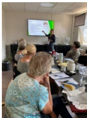
Gruppeledervedtagelse august 2022